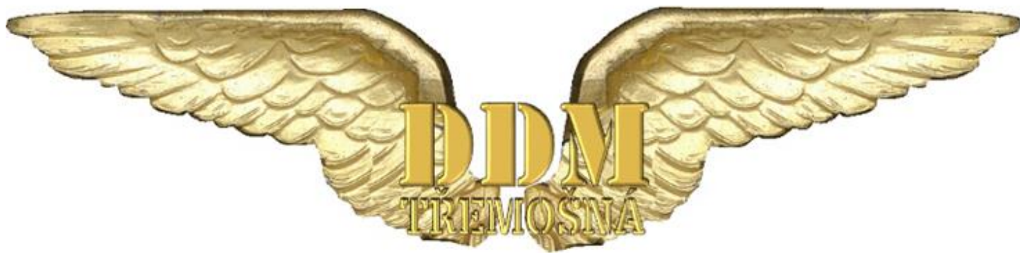
znak letecko-pašutistického tábora Czech Special Forces

Letecko-pašutistický tábor , tak jak jej již známe, začne osvědčenou klasikou. V první polovině našeho pobytu na letišti budeme provádět pozemní pašutistický výcvik. Hlavní důraz je kladen na fyzickou náročnost. Ranní rozcvičky, výcvik v sebeobraně a v boji z blízka. Slaňování z výškových budov, přístrojové potápění. Noční taktické výsadky, orientace podle buzoly a mapy v neznámém zalesněném terénu. Pěší přesuny se zátěží těžko prostupným terénem ve dne i v noci. Přežití v přírodě. Nic nového, to vše jsme již zažili. Proto bude velmi důležité mít na táboru doporučenou outdoorovou výstroj. Vše je uvedeno v příručkách. Postupně se dostaneme ke kapitole letecký výcvik . Nejdříve se seznámíme s nutným minimem potřebných teoretických znalostí, pak nás čeká létání na simulátorech a postupně každý provede samostatně svůj reálný, pilotovaný let motorovým letadlem, pod dohledem instruktora. Teoretické znalosti získáme z příručky pro malé letce, která je v příloze mailu. Je třeba si ji přečíst, abychom na letecko-pašutistickém táboru nebyli za úplně neandrtálce, ale letce(!)