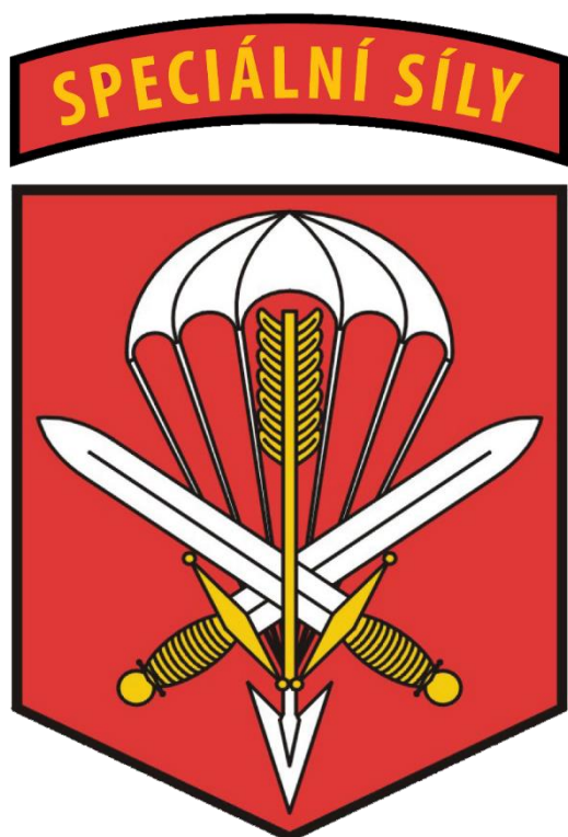
601. skss Armáda České republiky