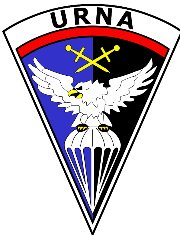
útvár rychlého nasazení policie ČR