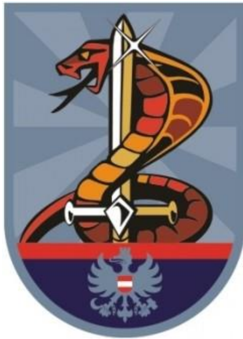
EKO Cobra Rakousko