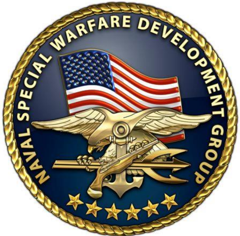
US NAVY SEALs