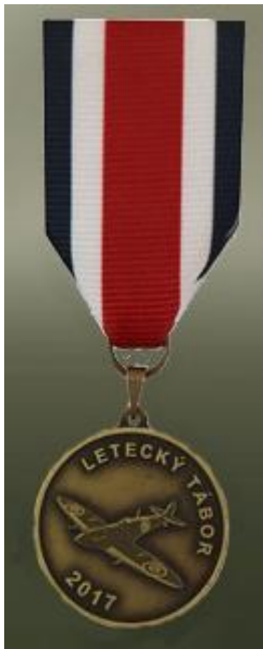
Pamětní táborová medaile 2017