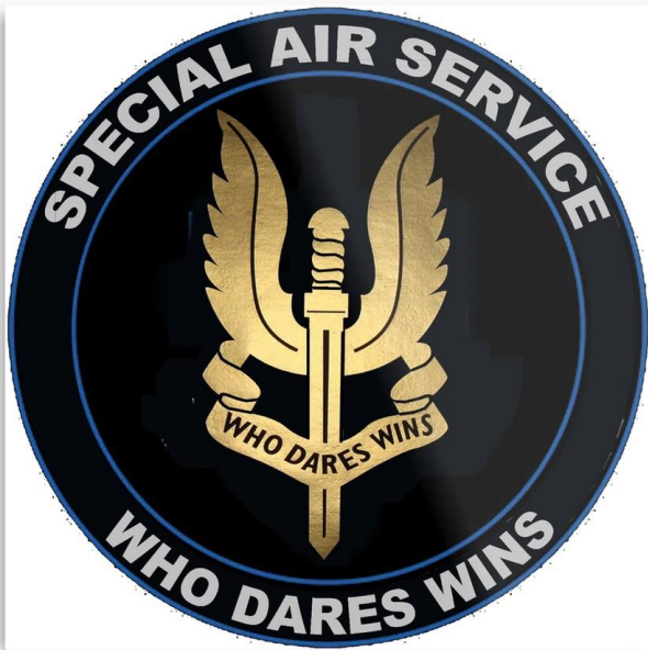
SAS Velká Británie